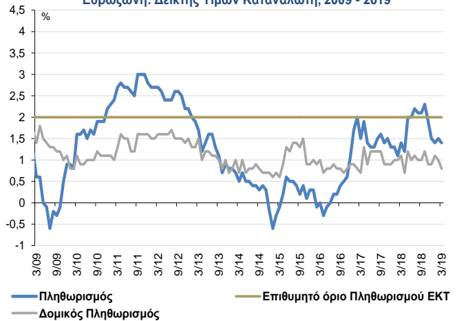
Ευρωζώνη: Δείκτης Τιμών Καταναλωτή, 2009 - 2019

Η Ευρωπαϊκή Κεντρική Τράπεζα διατήρησε αμετάβλητη την πολιτική της, όπως αναμενόταν. Αναμένει ότι τα επιτόκια της θα διατηρηθούν αμετάβλητα τουλάχιστον για ολόκληρο το 2019 και σε κάθε περίπτωση για όσο χρειασθεί έως διασφαλιστεί ότι ο πληθωρισμός θα ενισχυθεί σταδιακά σε μεσοπρόθεσμο ορίζοντα. Οι κίνδυνοι για την οικονομική ανάπτυξη θεωρούνται καθοδικοί. Επισημάνθηκε ότι οι γεωπολιτικές εξελίξεις και τα μέτρα προστατευτισμού στο διεθνές εμπόριο επιβαρύνουν την οικονομία. Η ΕΚΤ διαπιστώνει ότι πρόσφατα οικονομικά στοιχεία εξακολουθούν να είναι αδύναμα, με αποτέλεσμα να θεωρείται αναγκαία η διατήρηση της νομισματικής στήριξης. Η Ευρωπαϊκή Κεντρική Τράπεζα είναι έτοιμη να αναπροσαρμόσει την πολιτική της, εφόσον κριθεί αναγκαίο. Ως ευνοϊκούς παράγοντες για την οικονομία ανέφερε την ενίσχυση της απασχόλησης και των μισθών.